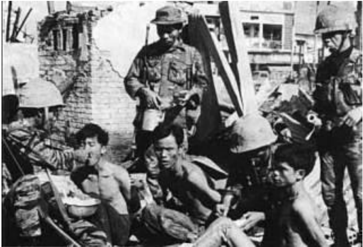
Cái này mà gọi là Mỹ-Ngụy độc ác sao ?