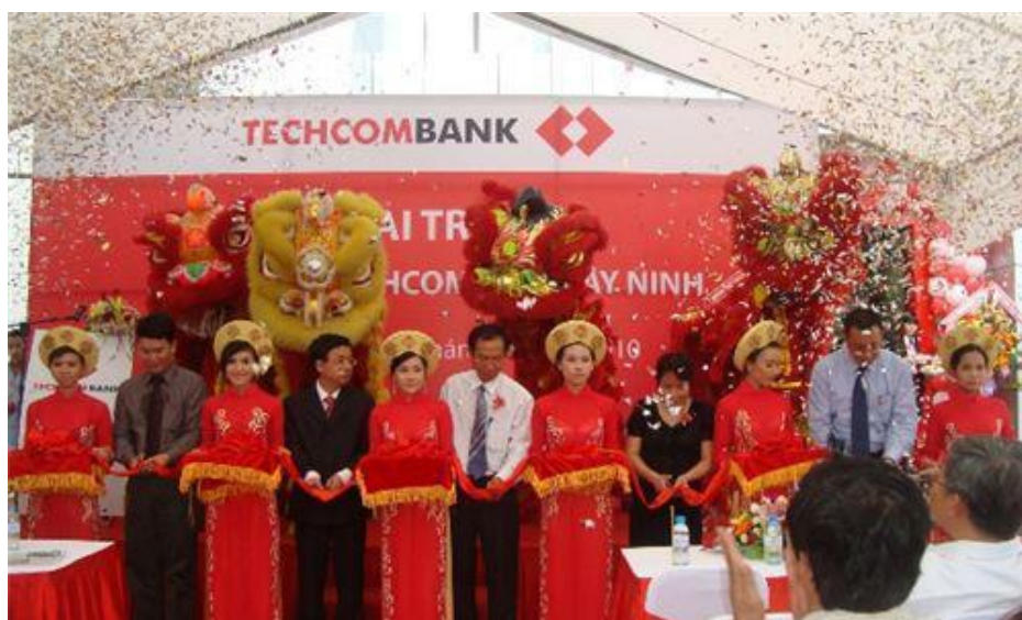
Tin từ Quan Lâm Báo thì Techcombank có xuất phát từ 16 tấn vàng mà CSVN cướp được của VNCH.