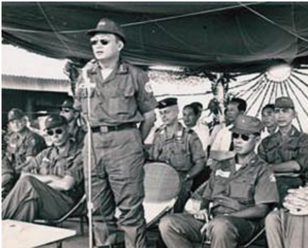
Cựu trung tướng Đặng Văn Quang đã từng bị tố cáo tham nhũng nhưng ông lại sống cuộc đời nghèo khổ ở nước ngoài !

Và thật cũng kỳ lạ thì cựu TT Nguyễn Văn Thiệu cũng giống như cựu trung tướng Đặng Văn Quang lại không có được cuộc sống dư giả, thậm chí cựu tướng Quang còn sống trong nghèo khổ trong khi họ bị mang tiếng là “tham ô, buôn bạch phiến...”. Câu chuyện thật về 16 tấn Vàng mà CSVN dựng chuyện lên để báo chí phương Tây và cả một số người phía người Quốc gia đã ngây thơ tin vào điều bịa đặt đó. Nó là một trong những điều mà CSVN mong muốn để đánh sập một chế độ dân chủ bậc nhất trong lịch sử Việt Nam cho đến ngày nay.