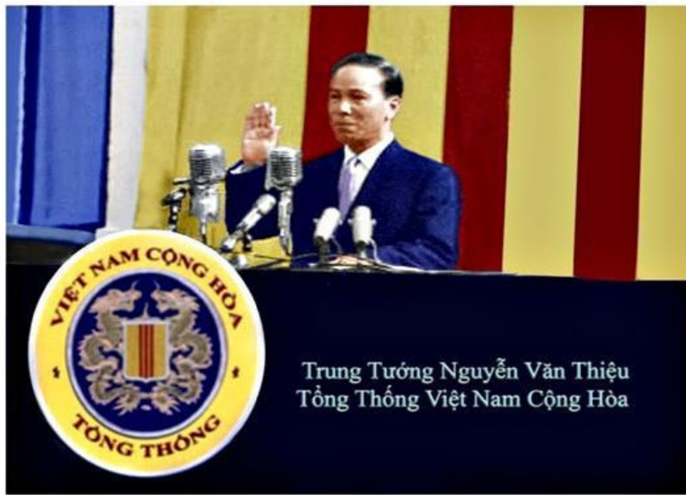
Cựu TT VNCH- Nguyễn Văn Thiệu và câu nói nổi tiếng : “Đừng nghe những gì cộng sản nói !”

Như đã từng nói trong Phần 1 – Quyển 3 thì CSVN dùng nhiều chính sách để chia rẽ và bôi nhọ cộng đồng người Việt Quốc Gia. Trong bài này, người viết xin đề cập đến câu chuyện của cựu tổng thống VNCH – Nguyễn Văn Thiệu. Câu nói để đời của ông “Đừng nghe những gì cộng sản nói, hãy nhìn những gì cộng sản làm” đã vận vào đời ông qua câu chuyện 16 tấn vàng nổi bật. Đó là một phần trong sách lược ngậm máu phun người, chia rẽ đoàn kết của cộng đồng người Việt Quốc Gia của CSVN. Câu chuyện đó được bắt đầu như thế nào...?