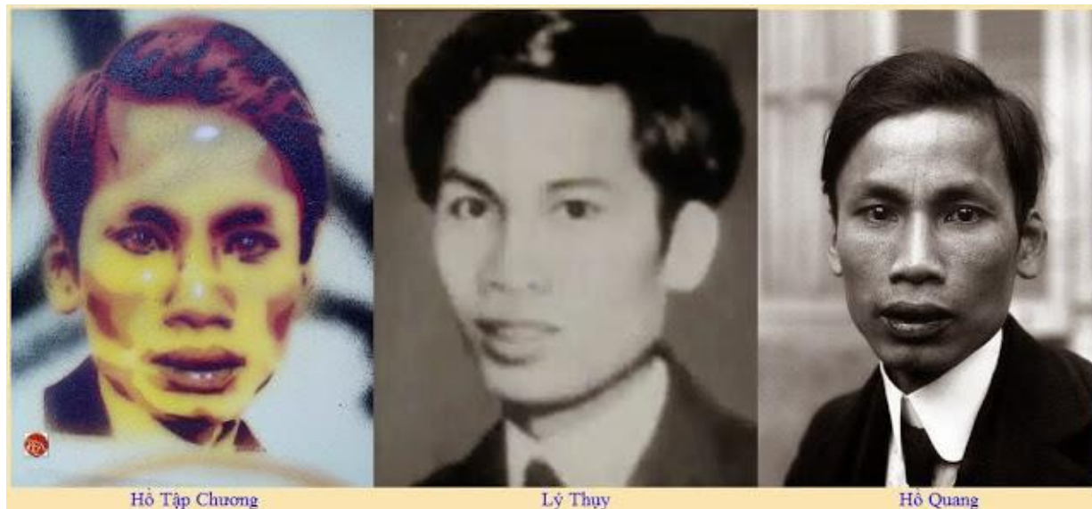
Hồ Tập Chương