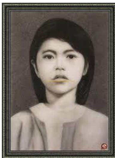
Võ Thị Sáu (1933-1952)