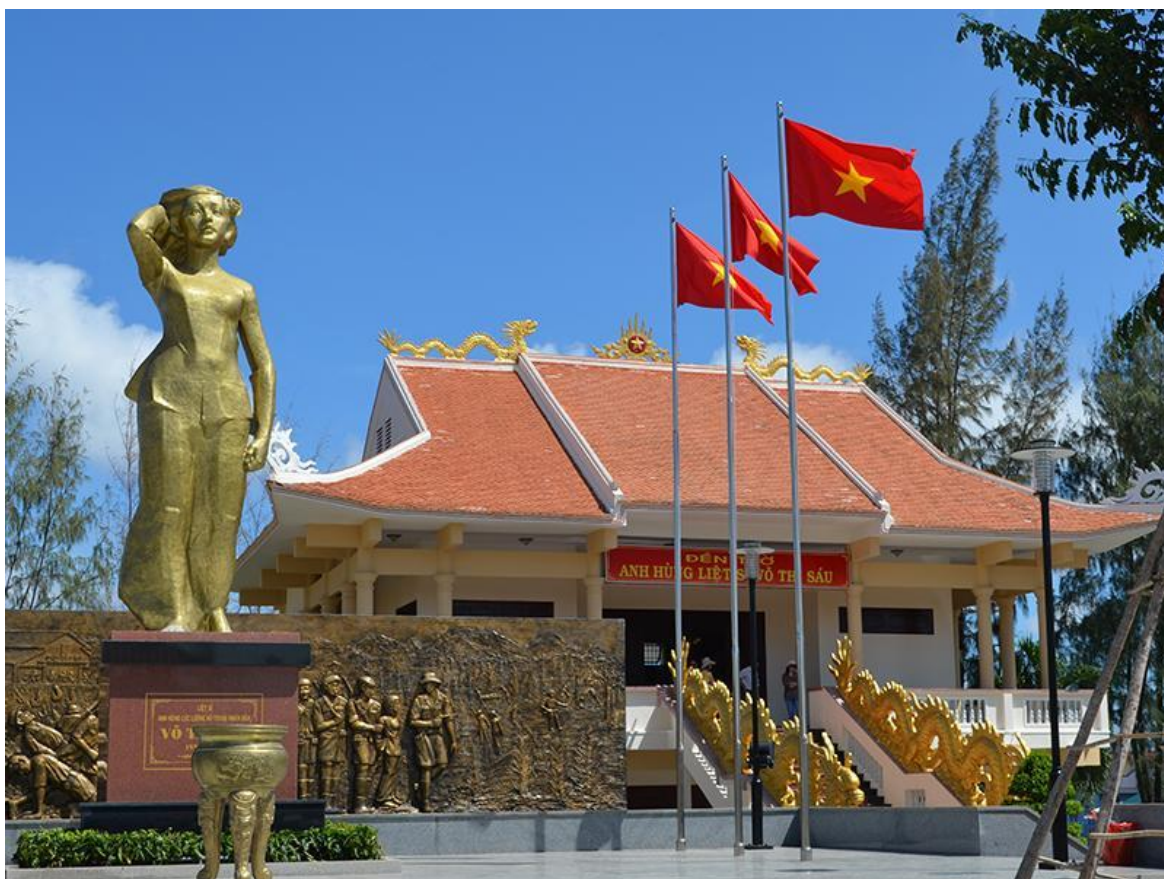
Nhà lưu niệm và tượng đài anh hùng “Sáu Khùng” tại tỉnh Bà Rịa--Vũng Tàu

Ngoài ra Võ Thị Sáu còn có biệt danh là “ Sáu Khùng ” theo lời của những người dân địa phương.