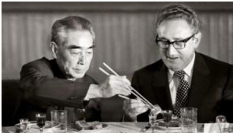
Henry Kissinger và Chu Ân Lai

Cuối năm 1979, Cựu Tổng thống Việt Nam Cộng Hòa Nguyễn Văn Thiệu, người ít khi lên tiếng từ khi sống lưu vong sau tháng Tư 1975, đã dành cho tạp chí Spiegel của Đức một cuộc phỏng vấn dài về kết cục của Chiến tranh Việt Nam.