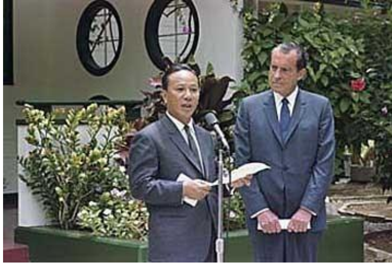
Nguyễn Văn Thiệu và Richard Nixon tại cuộc họp ở Midway 1969

Nguyễn Văn Thiệu: Trước khi họp ở Midway, việc chính phủ Mỹ dự định rút quân đã không còn là điều bí mật. Cho phép tôi nhắc để các ông nhớ lại, tin tức về việc Mỹ sẽ rút một số quân đã loan khắp thế giới, trước cuộc họp ở Midway. Vì sao? Theo tôi, chính phủ Mỹ muốn thả bóng thăm dò, tiết lộ thông tin trước cho báo chí và đẩy chúng tôi vào sự đã rồi.