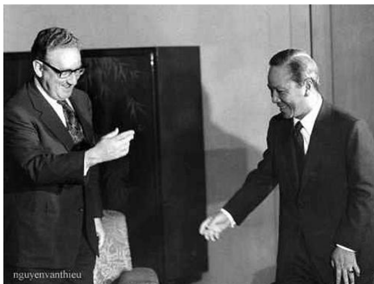
Nguyễn Văn Thiệu và Henry Kissinger