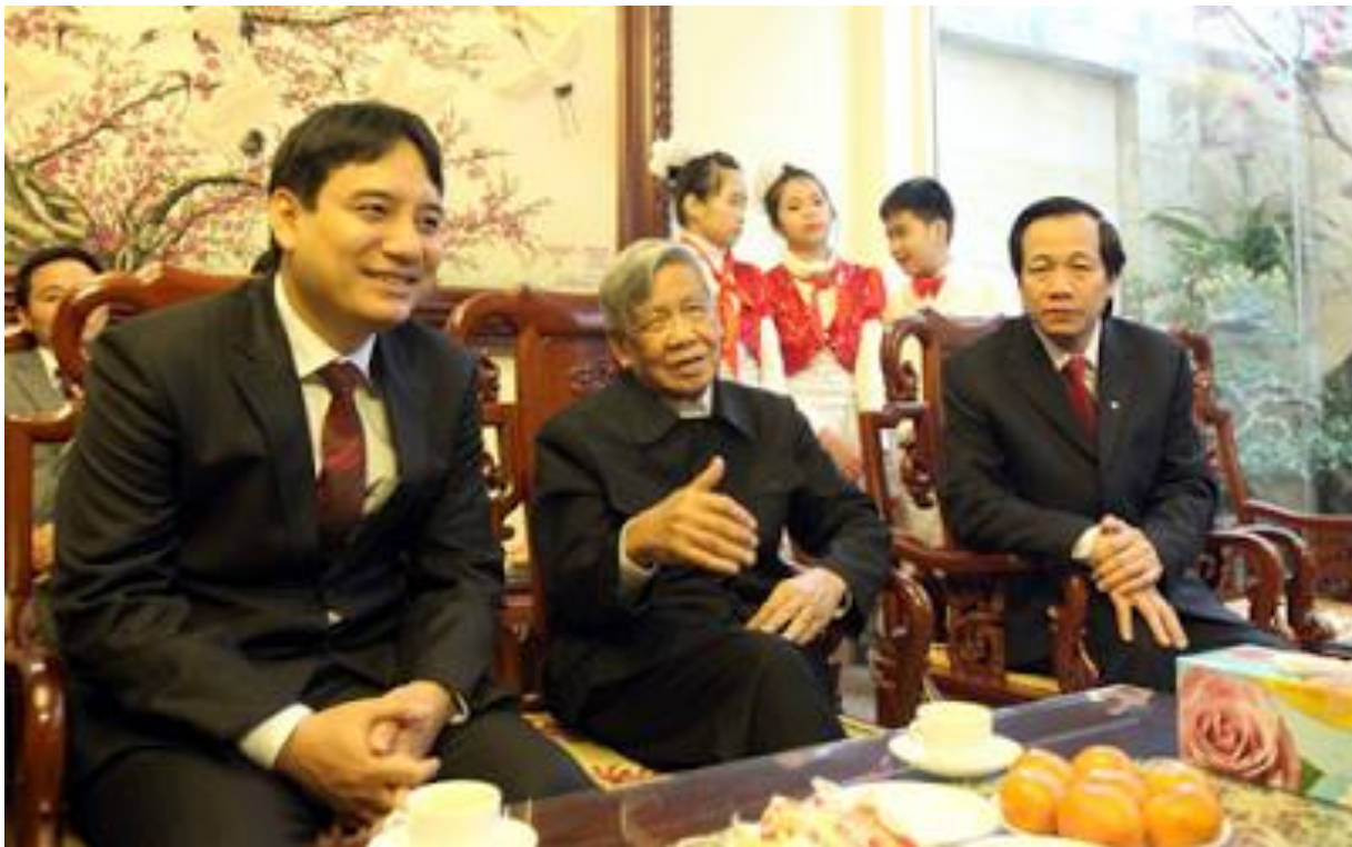
Phiêu đang thể hiện "mệnh môn tình dân"

Qua loạt ảnh trên chúng ta thấy điều gì? Đó là trong khi đại bộ phận dân sống xa nghèo đói thì Phiêu có cuộc sống quá sức xa hoa. Ngoài căn nhà đồ sộ thì Phiêu còn trưng nào là Ngà voi, Trống đồng, Tranh quý, Bàn gỗ quý v.v... Vậy nếu liêm khiết thì tiền đâu ra? Điều đó nói lên tất cả bản chất thật của Lê Khả Phiêu.