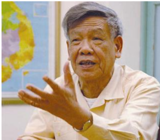
Kẻ bán nước - Lê Khả Phiêu

thời điểm Trung Quốc cần những quyết định của phía Hà Nội để kết thúc tiến trình đàm phán Hiệp định Biên giới. Và Phiêu đã làm những điều bán nước mà chúng ta thấy trên thực tế trong những năm qua.