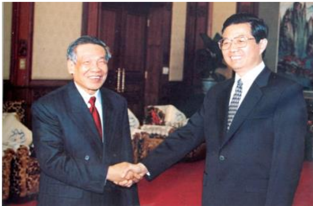
Hồ Cẩm Đào tiếp Tổng Bí thư Đảng Cộng Sản Việt Nam Lê Khả Phiêu. Thời gian 26-2-1999. Địa điểm Nhà khách Chính phủ Điều Ngự Đài, Bắc Kinh.

9) Ngày 26 tháng 2 năm 2001 Nguyễn Mạnh Cầm bay sang Trung Quốc để gặp Qian Qichen tại đảo Hải Nam. Nguyễn Mạnh Cầm cảm ơn Trung Quốc đã mua vùng Vịnh Bắc bộ của Việt Nam (Beibu Bay) với giá 2 tỉ USD.