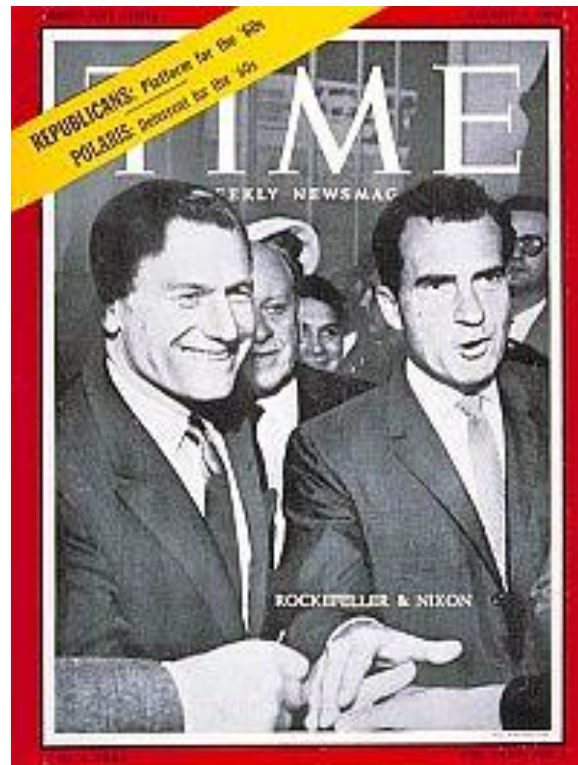
Nelson Rockefeller, shown on Time's Aug 1960 cover, had previously battled Nixon for the nomination and lost.

Nước láng giềng Cambodia của chúng ta cũng giống như chúng ta: bị người Mỹ bịp, và vì thế ông Sirik Matak mới có lá thư gửi cho ông đại sứ Mỹ như chúng tôi ghi lại trên trang đầu của bài viết. Phần đông chúng ta vẫn tưởng nước Mỹ thay đổi chính sách mỗi khi có một tổng thống mới lên cầm quyền. Vì thế mới bị làm, và bị làm rồi mà vẫn cứ hy vọng. Nghị sĩ Barry Goldwater cho biết: khi một tổng thống lên nắm quyền, đó chỉ là vấn đề thay đổi nhân sự, nhưng chính sách không thay đổi. Ông đưa ra thí dụ, thời TT Nixon Cộng Hòa, Henry Kissinger là thành viên CFR, người được Nelson Rockefeller đỡ đầu, nắm chính sách ngoại giao. Khi Jimmy Carter Dân Chủ đắc cử, Kissinger được thay thế bởi Brzezinski. Brzezinski cũng là thành viên CFR và được David Rockefeller che chở.