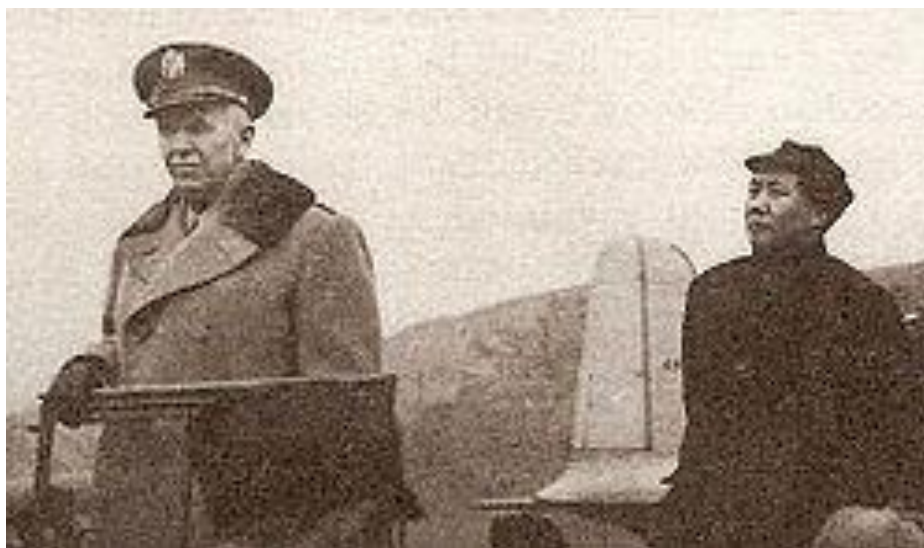
George C. Marshall with Mao in Yanan The Marshall Mission(December 20, 1945 - January,1947)

Phần đông người ta đã quên những chuyện kỳ lạ xảy ra dưới thời TT Harry Truman (người kế vị TT Roosevelt). Trước hết, sau khi ông ký Hiến Chương Liên Hiệp Quốc, bản văn thừa nhận cơ quan quốc tế này là một Chính Phủ Toàn Cầu. Sau đó ông nhường quyền kiểm soát Đông Âu và Trung Hoa cho CS. Khi công luận bắt đầu nêu thắc mắc tại sao ông phản bội hàng trăm triệu con người để làm thân phận nô lệ, thì ông đã đưa đẩy rằng cuộc chiến tại Á Châu không thắng được. Khi đại tướng MacArthur nói với một vị dân biểu rằng ông không được phép chiến thắng trong cuộc chiến Triều Tiên, thì TT Truman cách chức tư lệnh của ông. Tướng Lâm Bưu, tư lệnh quân đội Trung cộng tham chiến tại Bắc Triều Tiên thừa nhận rằng đã có một thỏa thuận bí mật ngăn chặn quân lực Mỹ chiến thắng tại Triều Tiên. Lâm Bưu viết: Tôi không bao giờ tấn công để phải hy sinh binh sĩ và danh tiếng của tôi, nếu tôi không được bảo đảm rằng Washington hạn chế những biện pháp trả đũa tương xứng của tướng MacArthur nhằm vào những tuyến đường tiếp liệu và truyền tin của chúng tôi.