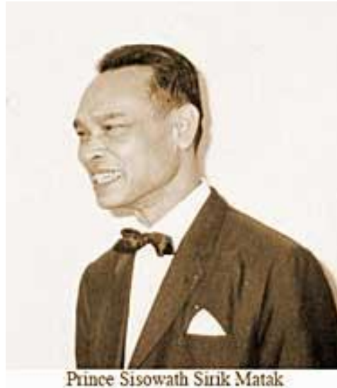
Prince Sisowath Sirik Matak

Prince Sisowath Sirik Matak (January 22, 1914 — April 21, 1975) was a prince of Cambodia.