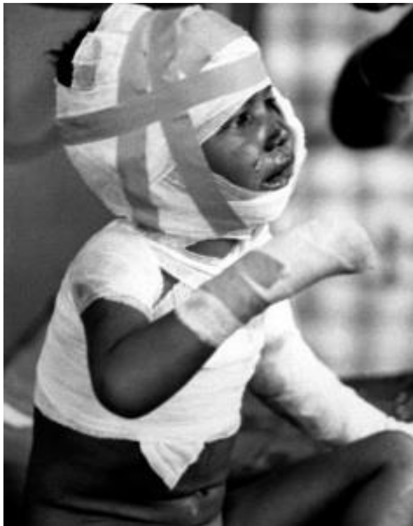
Trẻ em bị thương nặng được băng bó