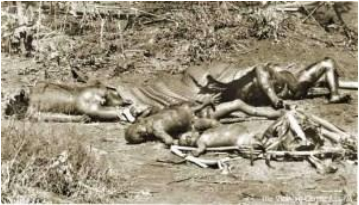
Xác chết dân làng nằm rải rác khắp nơi thân thể bị đốt cháy