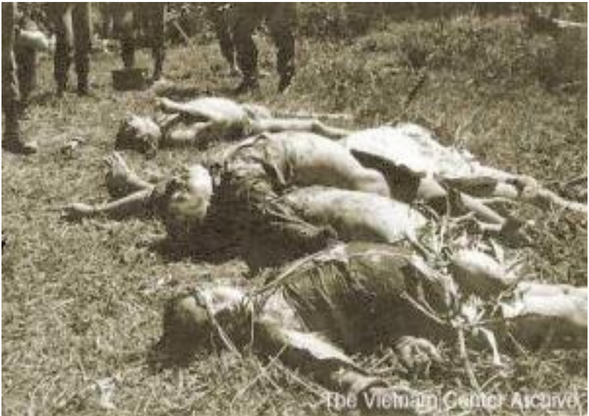
Xác chết la liệt khắp nơi trong làng