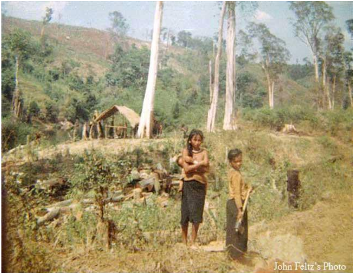
Montagnard people of Song Be