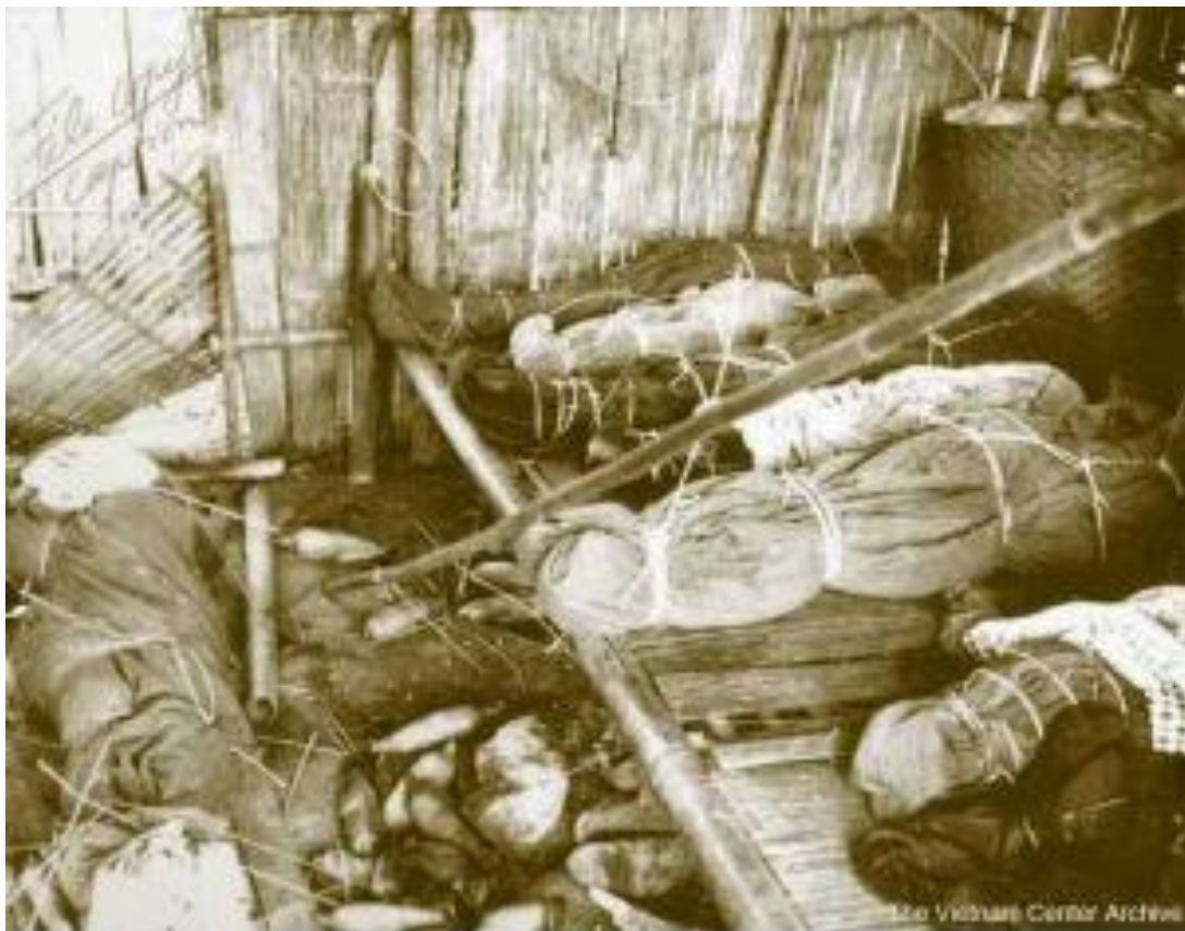
Dak Son Massacre - Bodies wrapped in available material await burial in one of the few remaining huts. These bodies were removed from a tunnel shelter.

Xác người dân Thượng (Montagnard) bị giết tại Đắk Sơn được bọc lại để sửa soạn đem chôn. Những xác này tìm được từ một căn hầm trú ẩn.