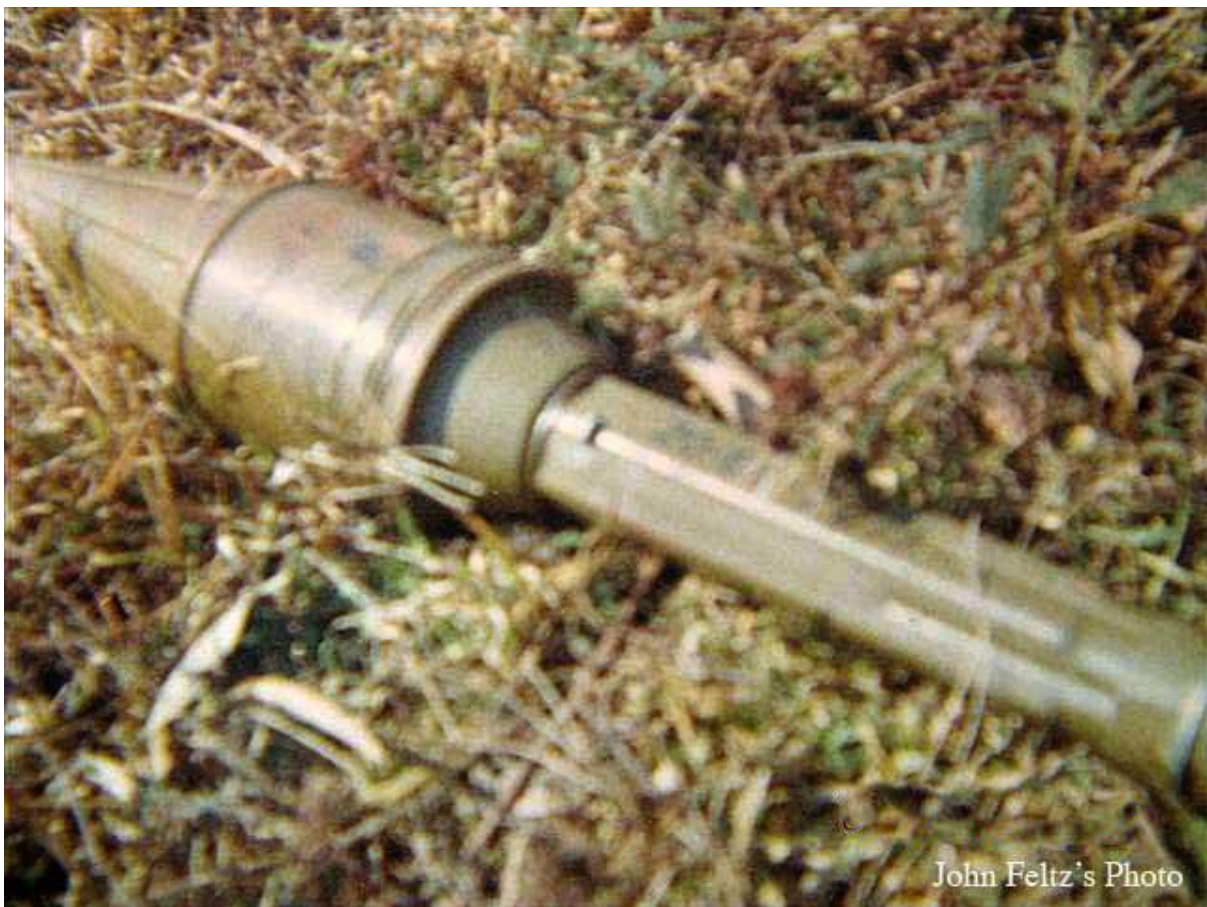
John Feltz's Photo