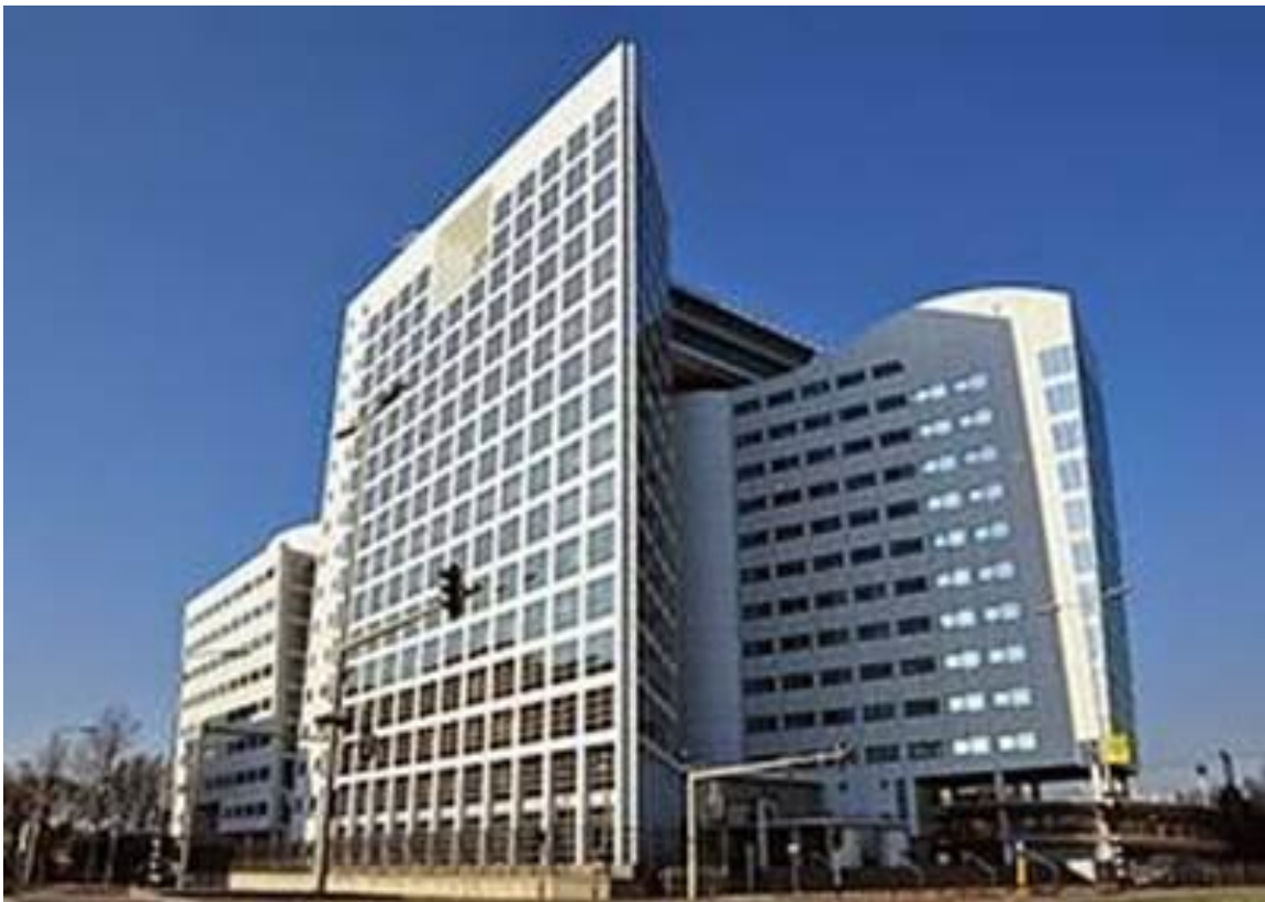
ICC ở Den Haag-Hoà Lan

Đây là một trong những bằng chứng tiêu biểu cho hàng ngàn, hàng trăm ngàn tội ác của csVN trong cuộc chiến đã qua. Cs VN đã không từ chối bất cứ thủ đoạn phi nhân nào để hoàn thành cuộc chiến xâm lược miền nam VN. Cái mà chúng gọi là ” bạo lực cách mạng trong chiến tranh giải phóng”. Bác và đảng đã nhét vào hàng trang của các thanh niên trong QĐND là sự dã man và tàn ác với nhân dân miền nam. Trên nòng súng của họ đều mang chủ nghĩa căm thù được đảng và bác trao cho QĐND trước khi lên đường vào nam.