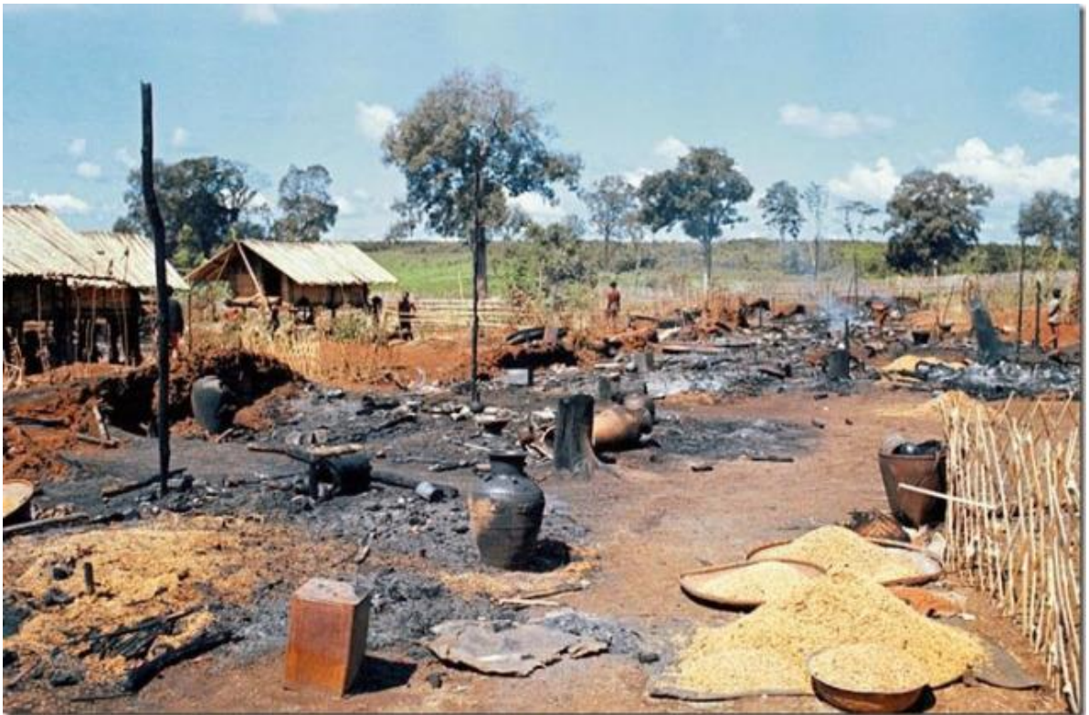
Làng Đắk Sơn bị bọn người khát máu phá hủy sau khi rút lui