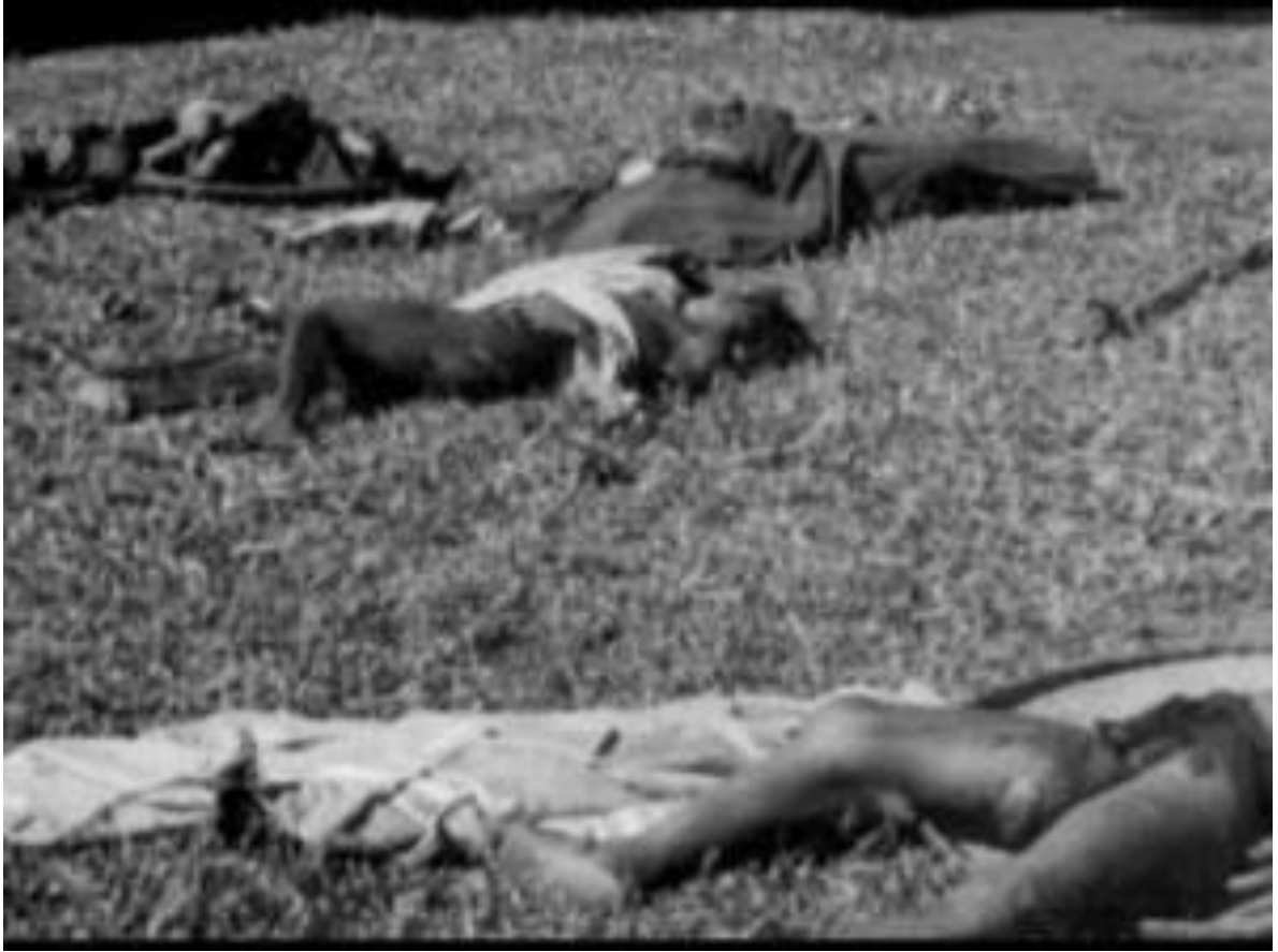
Xác chết dân làng Đắk Sơn nằm la liệt khắp nơi.