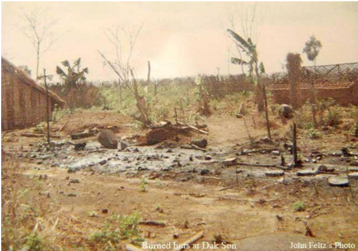
Burned huts at Dak Son