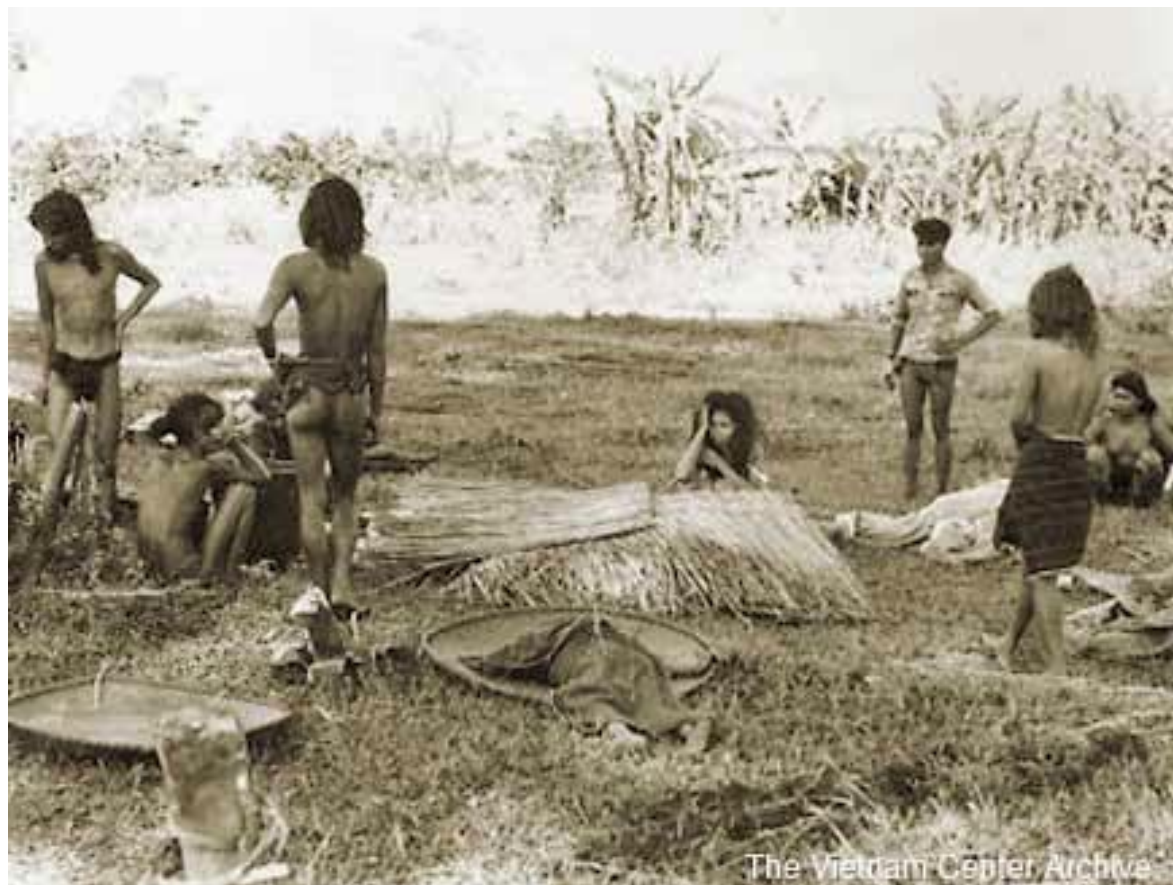
Những người dân làng còn sống sót tại Đắk Sơn.