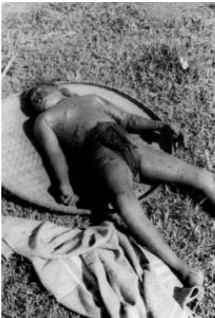
Trẻ con bị giết rất thương tâm