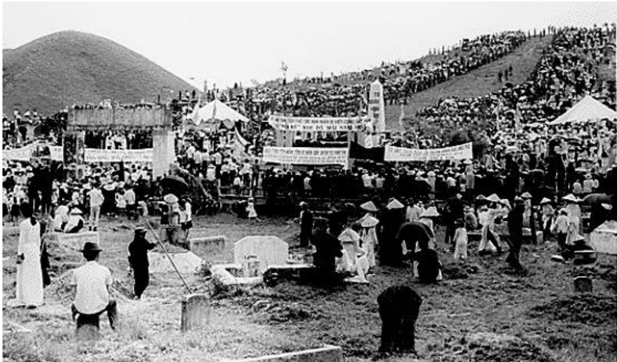
Nghĩa trang núi Ngự Bình-Huế, nơi tập trung chôn cất 6214 thường dân bị đảng Cộng sản Việt Nam thảm sát Tết Mậu Thân (1968).

lịch sử và địa lý Việt Nam đúc trên lu đồng vào thời vua Minh Mạng) chúng đem đi không được vì to lớn, cho nên chúng bắn vào đó để ghi dấu chiến tranh năm Mậu Thân.