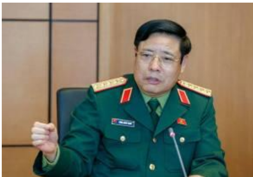
Tướng bán nước Phùng Quang Thanh

Thứ nhất , cuối tháng 10/2015, trong một phiên họp tại Quốc hội CSVN, Đại tướng Phùng Quang Thanh, lúc đó đang là Bộ trưởng Bộ Quốc phòng, có bài nói chuyện về tình hình quốc phòng và an ninh của đất nước. Họ Phùng khẳng định: “Nếu mà mất Đảng, mất chế độ thì biển đảo cũng mất” . (Link: http://www.datviet.com/bo-truong-phung-quang-thanh-mat-dang-mat-che-do-thi-bien-dao-cung-mat/ )