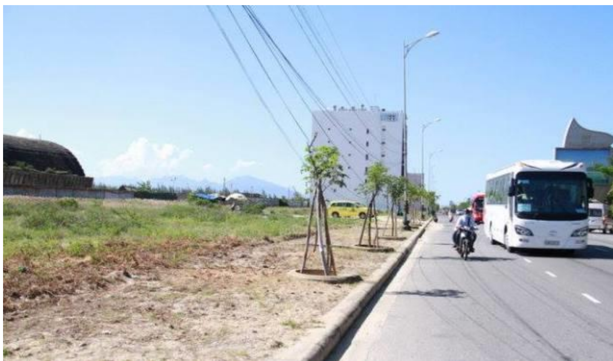
137 lô đất vị đắc địa đã bị Tàu mua và chiếm ngay cạnh sân bay quân sự

(Link: http://tuoitre.vn/tin/chinh-tri-xa-hoi/20151206/71-nguoi-da-nang-dung-ten-mua-137-lo-dat-cho-nguoi-trung-quoc/1015753.html )