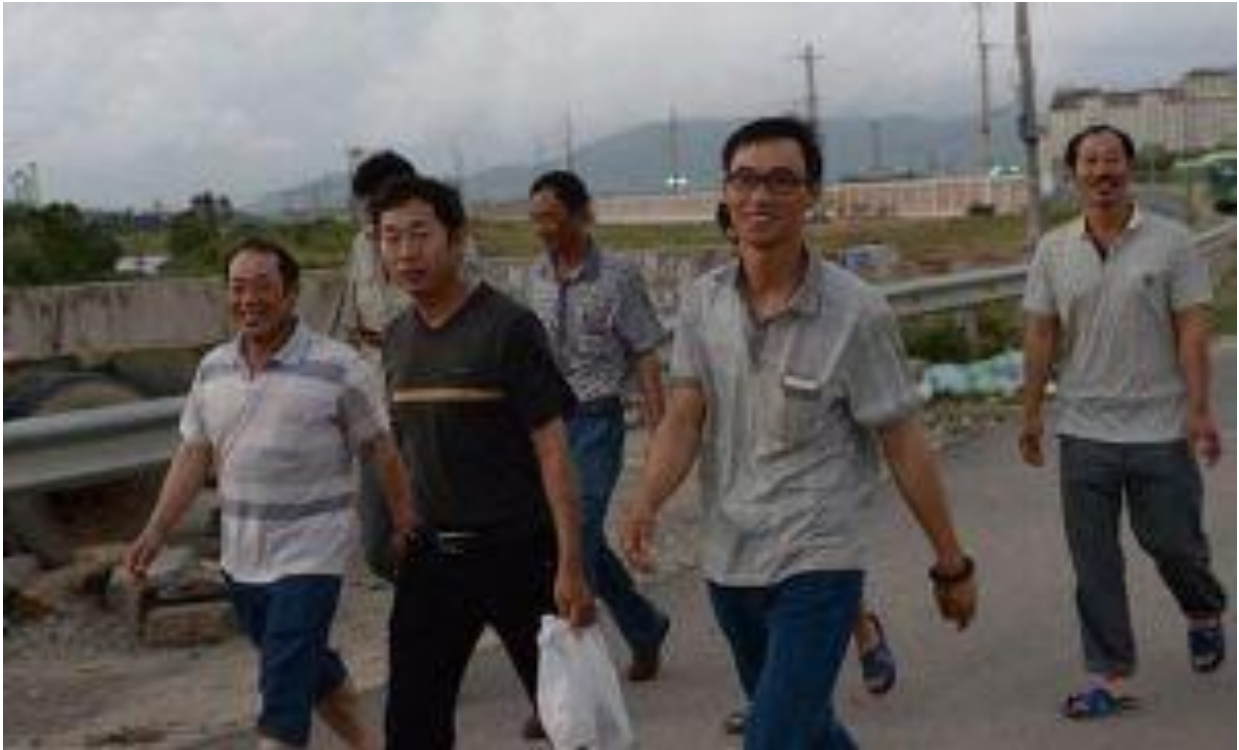
Người Tàu tại Formosa

bộ sậu đã công khai dâng Hoàng Sa- Trường Sa bằng công hàm phi pháp 1958.