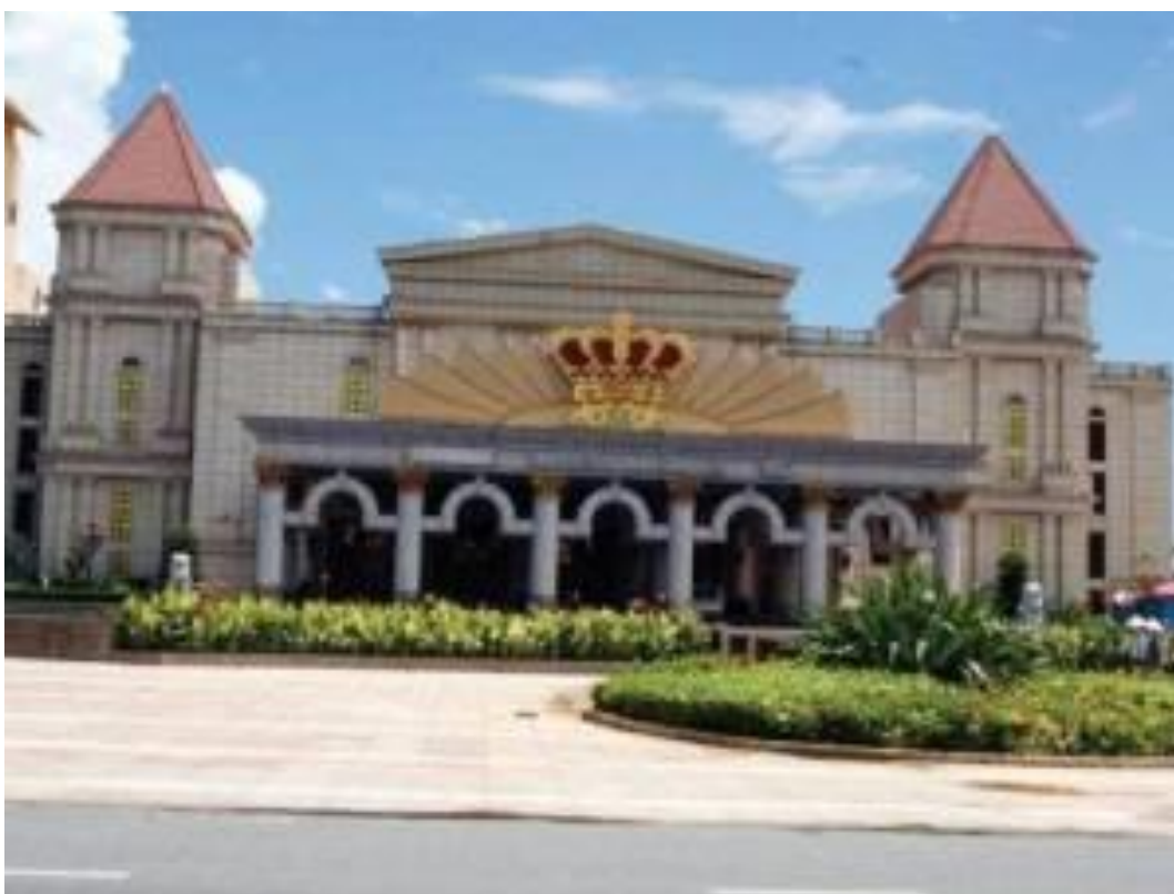
Khu resort của Công ty Silver Shores.

Theo tin báo chí trong nước đưa tin, ủy ban nhân dân thành phố Đà Nẵng đã cho phép Công ty TNHH Sichuan Huashi Trung Cộng đưa 300 lao động vào làm việc tại công trường thi công khách sạn 5 sao JW Marriott trên đường Võ Nguyên Giáp thuộc phường Khuê Mỹ, quận Ngũ Hành Sơn. (Link: http://baodatviet.vn/chinh-tri-xa-hoi/tin-tuc-thoi-su/da-nang-cho-300-lao-dong-trung-quoc-va-lam-viec-3292440/ )