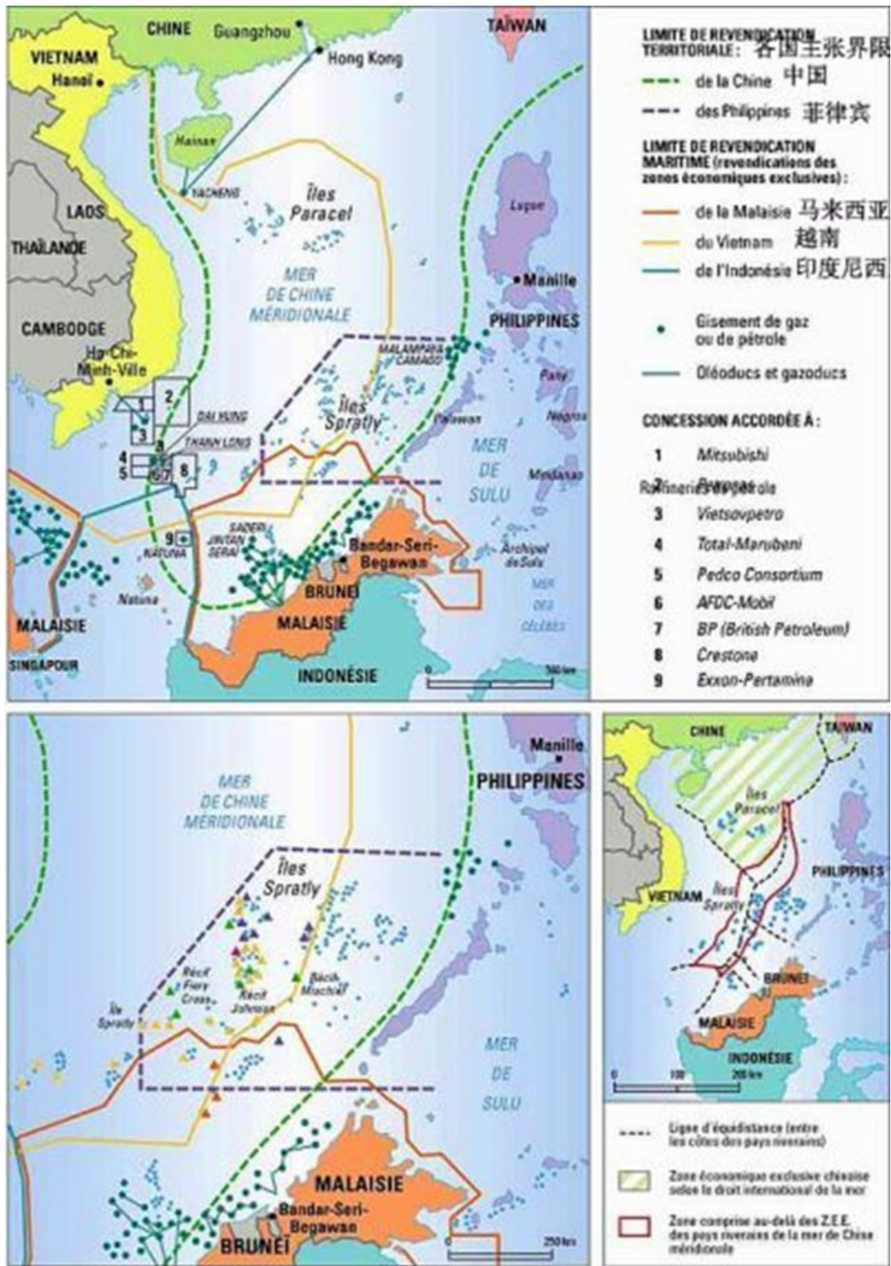
Bản đồ chiếm đất Việt Nam của Trung Cộng