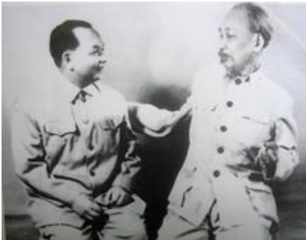
Trường Chinh và Hồ Chí Minh

Đây là một văn bản cho thấy đảng cộng sản chủ trương bán nước và Hán hóa dân tộc, kêu gọi làm chủ hầu rõ rệt nhất cho Trung cộng. Việc này là một sự cho thấy rõ nét âm mưu Hán hóa của đảng cộng sản trong vô vàn hành động khác.