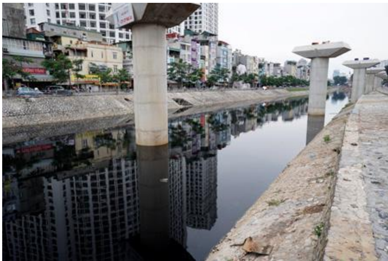
Những chiếc cọc đóng xuống lòng sông Tô Lịch

Nhưng có một điều mà Tàu cộng luôn lo sợ đó là linh khí đất Việt mà chính cụ Nguyễn Trãi đã từng viết “ Song hào kiệt đời nào cũng có “. Chính vì vậy nếu chúng ta nhìn vào sự kiện xây dựng tuyến đường sắt trên cao tại Hà Nội của cộng sản Việt Nam bằng tiền vay từ Trung Cộng sẽ thấy được một vấn đề lớn, phải chăng chính là âm mưu của đại Hán và tiếp tay bởi những Lê Chiêu Thống và Trần Ích Tắc đời nay ?. Câu trả lời thật không khó.