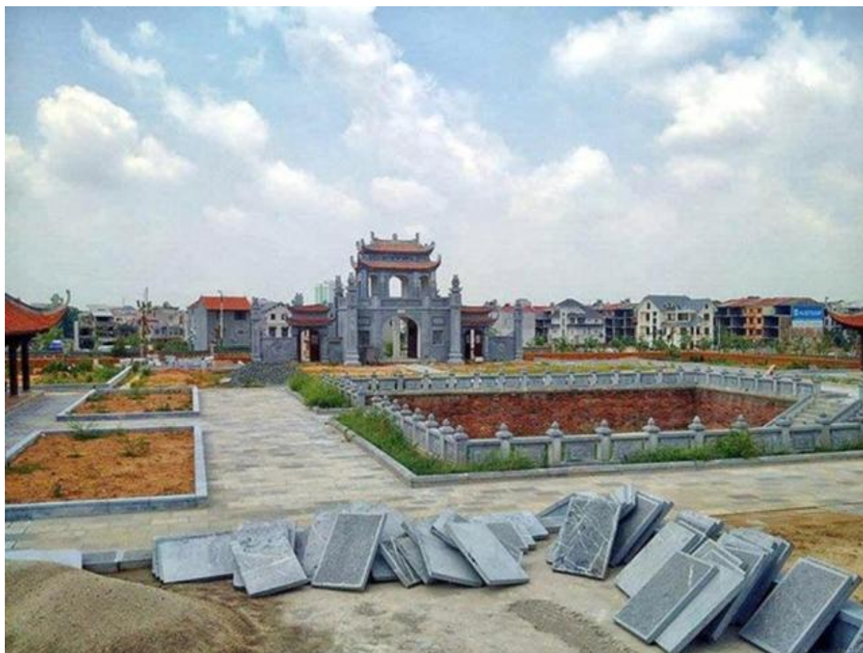
Đền thờ Khổng tử 13 triệu USD tại Vĩnh Phúc

Thông tin được nhà cầm quyền tỉnh Vĩnh Phúc, một trong những tỉnh thuộc hạng nghèo nhất của Việt Nam, đã chi ra hơn 13 triệu USD để xây dựng cái gọi là Văn Miếu để thờ “đức Khổng tử”. Theo đó, công trình này được nhà cầm quyền Vĩnh Phúc khởi công xây dựng từ năm 2011 và dự trù sẽ hoàn tất vào năm tới, trên một mảnh đất rộng hơn 4 mẫu tạ phường Liên Bảo, thành phố Vĩnh Yên., với thiết kế không khác gì một hoàng cung. Cần biết là trong tờ trình xin xây dự án này, nhà cầm quyền Vĩnh Phúc nói rằng các nước như Trung Cộng, Nhật Bản, Nam Hàn và kể cả Việt Nam đều xây dựng văn miếu để thờ “Khổng Tử”. Tuy nhiên, ngay sau khi biết được chuyện thờ Khổng Tử, rất nhiều người đã lên tiếng phản đối, yêu cầu không được thiết lập bài vị Khổng Tử trong tòa văn miếu này. Nhưng câu chuyện ở đây là như thế nào đây ?