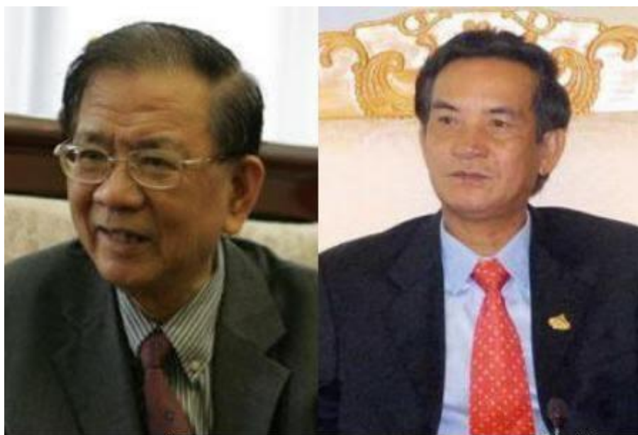
Nguyễn Duy Niên

Ngày 14 tháng 9 năm 2000, Tiền Kỳ Tham đi New York tham dự Đại hội đồng Liên Hợp Quốc lần thứ 55. Bộ trưởng Ngoại giao Nguyễn Duy Niên bí mật gặp tại trụ sở chính LHQ, hai bên trao đổi quan điểm, tập trung thảo luận những vấn đề tồn tại về Vịnh Bắc Bộ và đưa ra công thức phân định ranh giới theo chiều sâu đã đề nghị đàm phán lần trước.