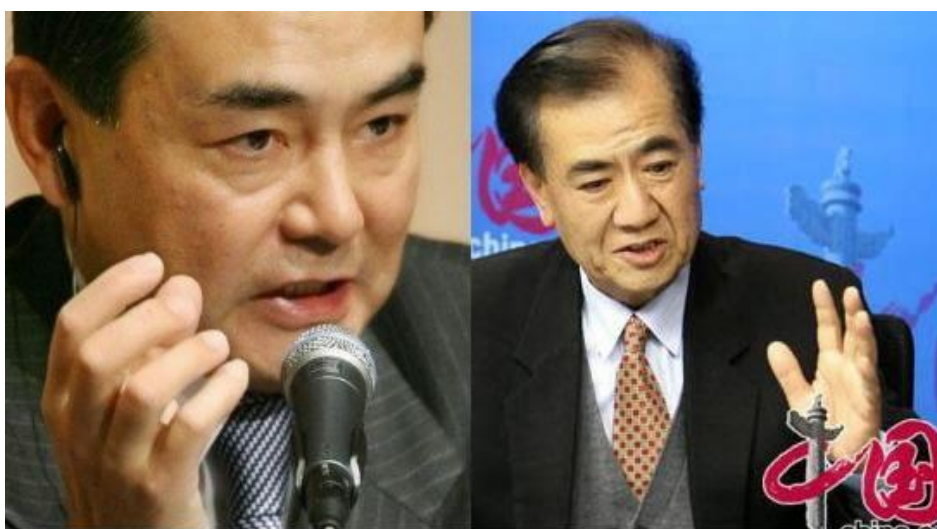
Vương Nghị (Wang Yi)

– Đã đến lúc chúng tôi xử lý vùng Vịnh Bắc Bộ của Việt Nam, thẳng thắn, thu về toàn bộ lãnh hải, nay phân giới cắm cột mốc chỉ là một động tác giả hình, nhằm che khuất lòng dân của bạn phần uất, chúng tôi thực hiện những gì dưới sự đồng tình của quý đồng chí. Đàm phán đã trở thành một phần quan trọng, chúng tôi muốn phân định ranh giới lãnh thổ và lãnh hải, đây là một hồ sơ Biển Đông cho phép hợp thức hóa trước Liên Hiệp Quốc, các bạn là người hỗ trợ cho chúng tôi. Một điều nữa, tác động lên lương ngư dân Việt Nam, mục đích của nó có liên quan đến việc duy trì ổn định trong khu vực Vịnh Bắc Bộ, cũng là một vấn đề chính trị mà nhà nước Việt Nam phải thi hành đúng luật pháp? Hy vọng, Việt Nam bắt đầu tiến hành ngay lập tức, sau khi cơ chế đàm phán thủy sản có hiệu lực, phân giới cắm mốc Vịnh Bắc Bộ và thủy sản sẽ được giải quyết theo qui định lịch sử đảng đã có từ trước vào thời Hồ Chí Minh và Chu Ân Lai ký hiệp ước, ngày 07 tháng 7 năm 1955, "Hiệp ước nhượng lãnh hải và Vịnh Bắc Bộ Vạn Niên".