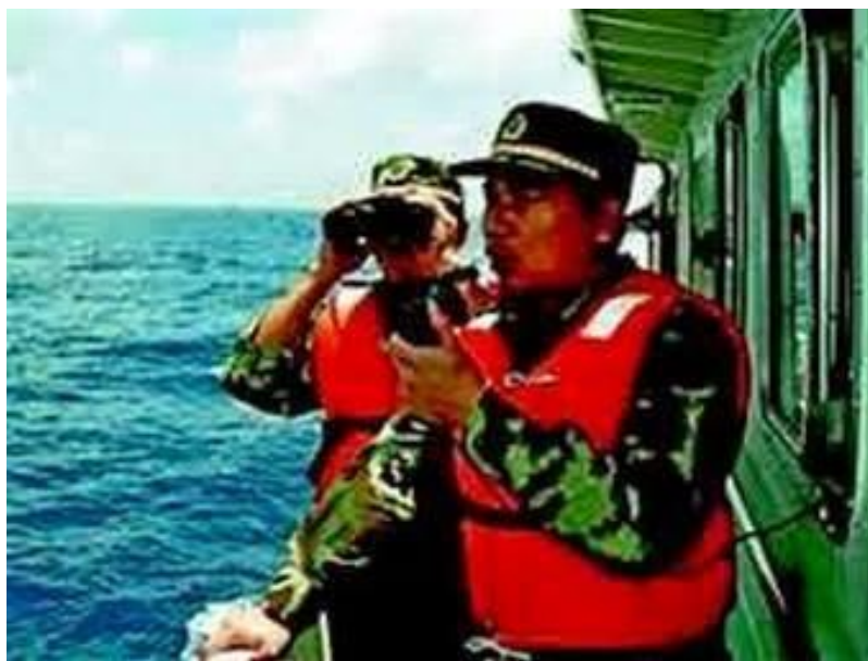
Hải giám Trung Cộng kiểm soát vùng Vịnh Bắc Bộ của Việt Nam.

"Hiệp định phân định Vịnh Bắc Bộ mở rộng" đã có hiệu lực, đánh dấu sự ra đời một biên giới biển đầu tiên của Trung Cộng. Việt Cộng thông qua tham vấn của Trung Cộng, giải quyết thành công giữa hai nước trong Vịnh Bắc của vấn đề phân định biển, pháp luật của chế độ biển phù hợp với thực hành hiện đại.