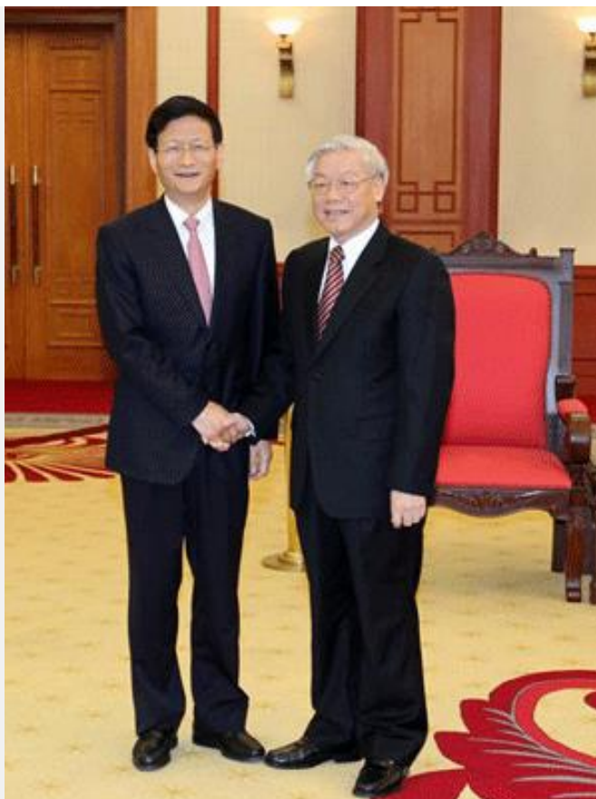
Trọng Lú và Mạnh Kiến Trụ

Thứ tư, Trong khi tham vọng của Trung cộng ở Biển Đông đã rõ như thế nhưng chỉ có 5 ngày sau khi CNOOC công bố (18/10/2012) việc sản xuất số lượng lớn dầu tìm thấy trong Vịnh Bắc Bộ thì chính Trọng Lú đã tiếp Ủy viên Quốc vụ Trung cộng Mạnh Kiến Trụ tại Hà Nội vào ngày 24/10/2012. Theo bài viết của báo điện tử đảng cộng sản Trung Quốc Mạnh Kiến Trụ đã nói với Trọng rằng: "Vấn đề Nam Hải (Biển Đông) không phải là toàn bộ của quan hệ Trung - Việt, nhưng xử lý không thỏa đáng sẽ ảnh hưởng đến toàn cục của quan hệ hai nước."