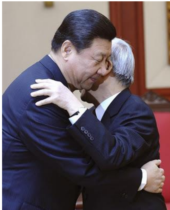
Thái Thú của Tàu ôm hôn ông chủ

1. Nguyễn Phú Trọng đã không được thông tin kịp thời và đầy đủ việc sáng ngày 20.3 các tàu hải quân Trung quốc đã truy đuổi và bắn cháy tàu của ngư dân VN. Trong trường hợp này thì Bộ trưởng Quốc phòng Phùng Quang Thanh và các cơ quan an ninh đối ngoại đã không thông tin cho ông Trọng, mặc dầu ông là Bí thư Quân ủy Trung ương, tức là Tổng tư lệnh quân đội VN. Như vậy phải hiểu là uy tín của ông Trọng đã mất trong nhóm lãnh đạo. Trong điều kiện hiện nay giả thuyết này khó có thể xảy ra.