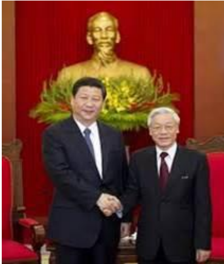
Trọng Lú và Tập Cận Bình

Thứ ba , ban tuyên giáo Trung Ương của Tô Huy Rứa trước đây và Đinh Thế Huynh ngày nay chính là tiếng nói của Trọng Lú và bầy đàn. Trọng đã bán nước nên Rứa đã tuyên bố như sau: " quan hệ hữu nghị truyền thống Việt Nam – Trung Quốc do Chủ tịch Hồ Chí Minh và Chủ tịch Mao Trạch Đông đích thân xây dựng, được các bậc lãnh đạo tiền bối hai nước dày công vun đắp là tài sản chung quý báu của hai Đảng và nhân dân hai nước, cần được giữ gìn, phát triển và truyền tiếp cho các thế hệ mai sau ". Rồi báo đảng còn cho biết: " Ông Tô Huy Rứa khẳng định Đảng, Nhà nước và nhân dân Việt Nam mong muốn cùng với phía Trung Quốc thực hiện nhận thức chung đạt được giữa lãnh đạo cấp cao hai Đảng, hai nước trong chuyến thăm Trung Quốc vừa qua của Tổng Bí thư Nguyễn Phú Trọng; thúc đẩy giao lưu, hợp tác trên mọi lĩnh vực giữa các bộ ngành, địa phương hai nước, giải quyết thỏa đáng những vấn đề còn tồn tại trong quan hệ hai nước, không ngừng thúc đẩy quan hệ láng giềng hữu nghị và hợp tác toàn diện Việt – Trung phát triển ổn định và lành mạnh, vì lợi ích của nhân dân hai nước, vì hòa bình, ổn định, phát triển trong khu vực và trên thế giới". (Links: http://www.baomoi.com/Cung-co-quan-he-doi-tac-hop-tac-chien-luoc-