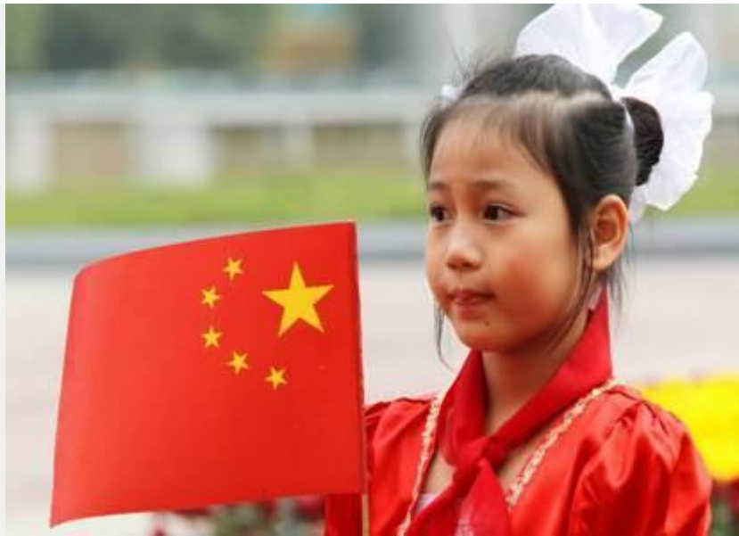
Và đây chính là kết quả Bán nước của Trọng Lú

Đó chính là một trong những bằng chứng hèn với giặc ác với dân của Trọng và đồng bọn mà nó được gọi đúng tên là : Bán nước !