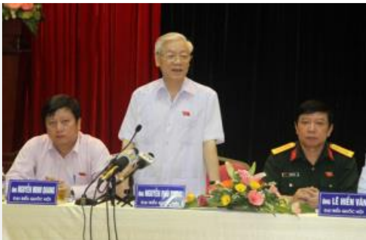
Trọng lúc đang ba hoa về "Xã hội chủ nghĩa"

Thứ hai , Chưa dừng lại ở đó, Trọng còn nói về việc tiến lên chủ nghĩa Xã hội và một số vấn đề liên quan như sau.