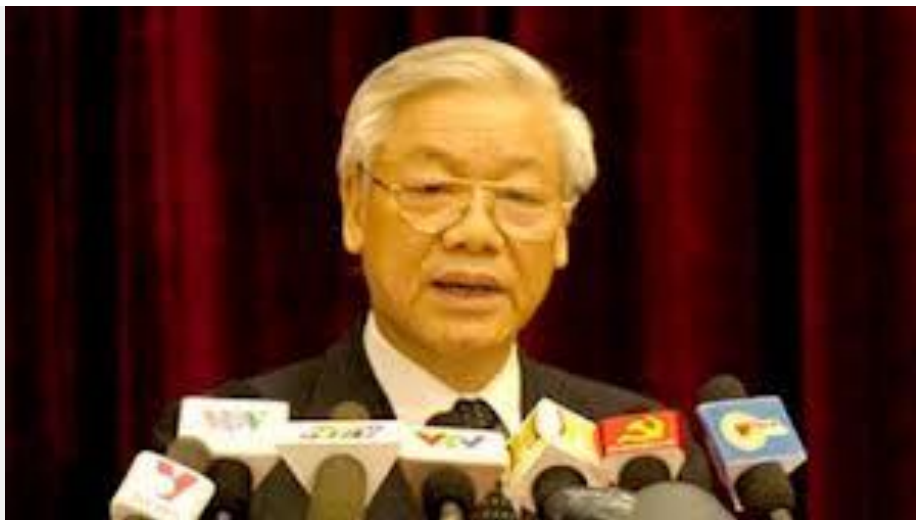
Đồng chí này coi Hiến Pháp là đồ bỏ đi

"(Links: http://www.rfa.org/vietnamese/vietnamnews/the-communist-party-platform-more-important-than-the-constitution-sec-general-09292013113833.html ).