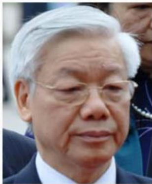
Nguyen Phu Trong

"How can a person like Mr Nguyen Phu Trong, who is responsible for the increasing number of human right abuses in a nation under the repressive rule of a mono-political party in which he is a top leader, be honoured by one of the oldest universities in Thailand that educates and advocates students 'to emphasise the benefits of living by the philosophy of sufficient economy, democratic values and social justice?'," the letter said.