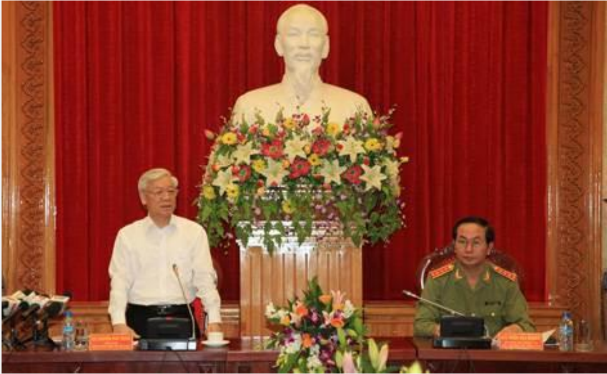
Trọng Lú đọc tài mượn tay công an để cưỡi cổ dân

Thứ năm, Đúng ra Công an phải sinh ra để bảo vệ nhân dân nhưng Trọng Lú cũng giống như bao nhiêu lãnh tụ cộng sản khác đã coi nó như công cụ bảo vệ đảng, bảo vệ chế độ chống lại nhân dân. Vì Trọng độc tài nên hẳn ta tuyên bố: " Phát biểu tại cuộc làm việc, Tổng Bí thư Nguyễn Phú Trọng đánh giá cao những kết quả mà Tổng cục Xây dựng lực lượng CAND đã đạt được trong thời gian qua; nêu bật vị trí, vai trò quan trọng của Tổng cục trong hệ thống tổ chức bộ máy của Công an, là lực lượng nòng cốt bảo vệ an ninh chính trị, trật tự an toàn xã hội, là thanh kiếm trước kẻ thù và là lá chắn để bảo vệ Đảng, bảo vệ chế độ và nhân dân. Trong giai đoạn hiện nay, Tổng Bí thư đặc biệt lưu ý, ngành công an nói chung và Tổng cục xây dựng lực lượng nói riêng không được lơ là, chủ quan, mất cảnh giác trước những âm mưu của kẻ địch... Công an phải tuyệt đối trung thành về chính trị, tư tưởng. Không được khúc mắc gì về tư tưởng... "