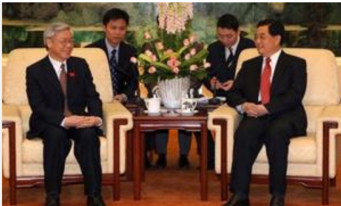
Lú và đàn anh

(Links: http://vnexpress.net/tin-tuc/the-gioi/bao-trung-quoc-dua-dam-ve-thoa-thuan-bien-dong-2207973.html )