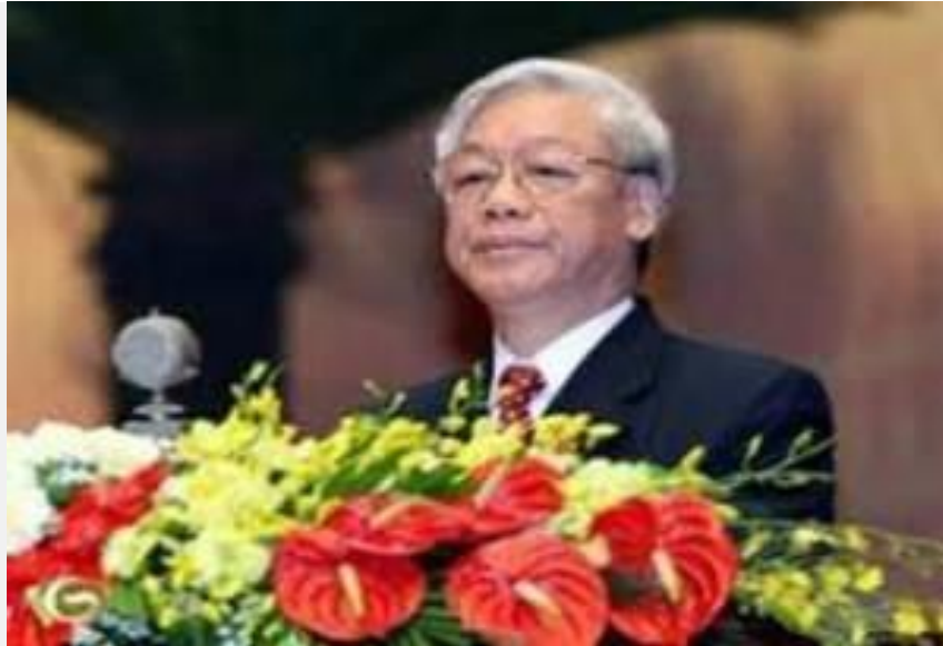
Kẻ lú lẫn Nguyễn Phú Trọng

Rõ ràng người ta chẳng hiểu Trọng nói cái gì, trên thì Trọng nói phức tạp để lấp liếm sự thật "HS-TS là của Việt Nam", rồi ở dưới Trọng bao biện cho hành động hèn với giặc để ngư dân bị bắt, bị đánh là "hòa dịu". Nói cách khác Trọng vừa lú vừa bán nước rất rõ ràng.