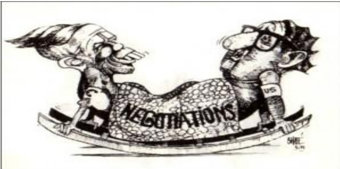
Henry Kissinger và Lê đức Thọ

Henry Kissinger viết nhiều sách chính trị, nhưng lại thích đọc sách văn chương, nhất là các tác phẩm của nhà văn Mỹ, William Faulkner (Nobel Văn Chương năm 1949). Năm 1973, lúc nhận nửa giải Nobel Hòa Bình, Kissinger đọc một bài diễn văn sắc bén, nhấn mạnh tới một đoạn: "Trong bài đáp từ khi nhận giải Nobel Văn Chương, William Faulkner đã nói rõ ràng về niềm hy vọng của ông: "Người ta không chỉ đơn thuần chịu đựng, mà người ta còn muốn thăng thế!". Ngày nay, chúng ta sống trong một thế giới phức tạp, lại đâu chỉ có chịu đựng mà còn phải thăng thế -vượt lên nhanh, khỏi những đe dọa- để thoát ra ngoài sự kiểm soát của nó, sự phức tạp và vượt lên khỏi mọi xung đột làm mờ tối nền hòa bình tự nhiên."