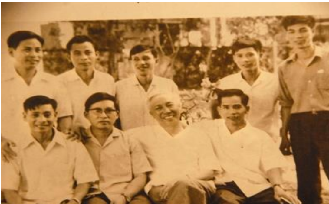
Lê Đức Thọ và những đàn em của mình

Như vậy qua những chứng cứ ta thấy điều gì? đó là Lê Đức Thọ tàn ác với nhân dân và bán nước, thần phục Trung Cộng. Đây là những tội ác khó có thể tha thứ được.