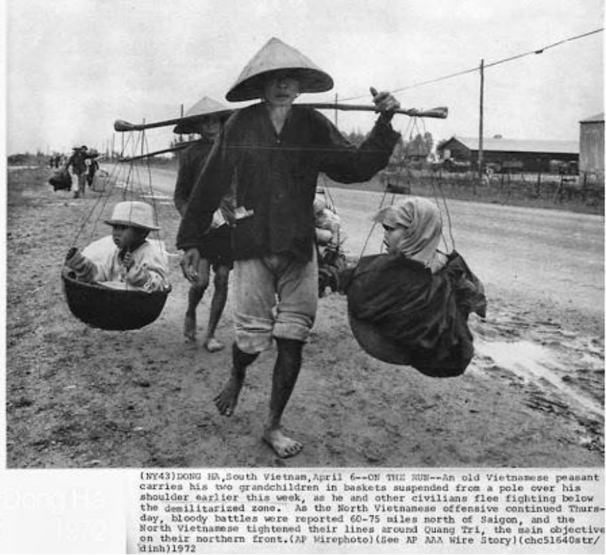
(NY43)DONG HA, South Vietnam, April 6--ON THE RUN--An old Vietnamese peasant carries his two grandchildren in baskets suspended from a pole over his shoulder earlier this week, as he and other civilians flee fighting below the demilitarized zone. As the North Vietnamese offensive continued Thursday, bloody battles were reported 60-75 miles north of Saigon, and the North Vietnamese tightened their lines around Quang Tri, the main objective on their northern front.(See AP AIA Wire Story)(che51640str/dinh)1972

Để thấy được điều này, chúng tôi xin gửi tới quý vị những dẫn chứng dưới đây: