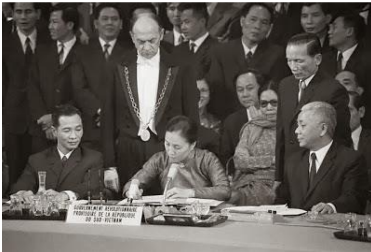
Nguyễn Thị Bình ký Hiệp định Paris