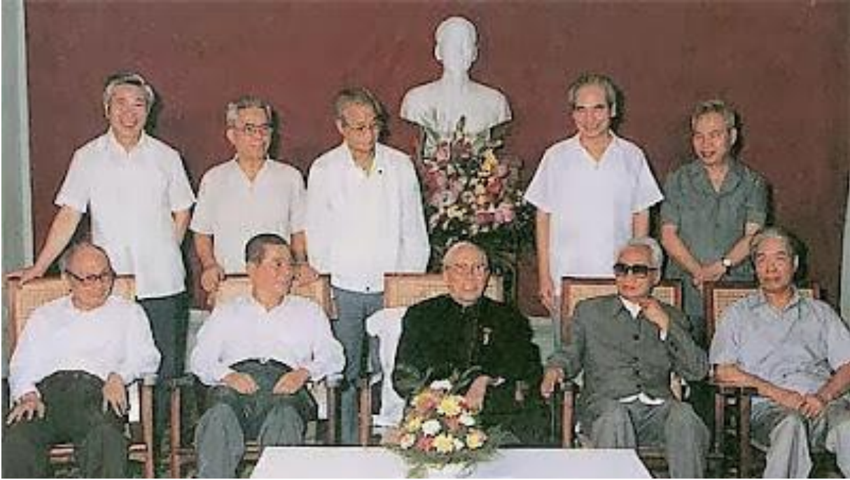
Lê Đức Thọ sau lễ trao Huân chương Sao Vàng. (6)

Thứ năm , Tướng Vernon Walters, Tùy viên Quân sự cấp cao ở Tòa Đại sứ Mỹ tại Paris. Ông là người liên lạc và sắp xếp các cuộc mật đàm "đi đêm" giữa Kissinger và Lê Đức Thọ. Sau khi Việt Nam Cộng Hòa sụp đổ, cho đến ngày hôm nay ông vẫn còn giữ lá cờ VNCH trong phòng làm việc của mình. Khi được hỏi tại sao ông vẫn giữ lá cờ ấy, ông giải thích lá cờ này tượng trưng cho "công việc còn dang dở. Chúng ta đã để 39 triệu người rơi vào cảnh nô lệ." (Theo Larry Berman trong tác phẩm " No peace, No Honor ", nhà xuất bản Free Press, trang 273.).