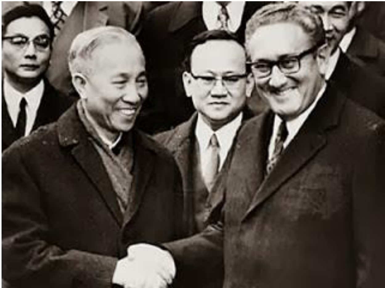
Lê Đức Thọ và Cố vấn Đặc biệt của Tổng thống Mỹ, Tiến sĩ Henry Kissinger

ta chằm dứt cảnh hai nhà cùng nòi giống tàn sát lẫn nhau. Hai miền Nam Bắc được thế giới tự do tiếp cận, giúp kiến thiết đất nước trong hòa bình.